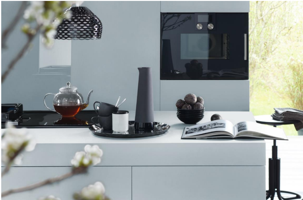
Beispiel der Farbkollektion Solutions4Furniture