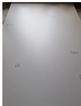
7. Streifen- und schlieren-freies Ergebnis