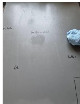
2. Feucht abwischen