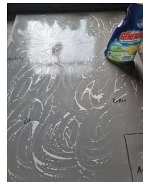
4. Reiniger flächig auftragen