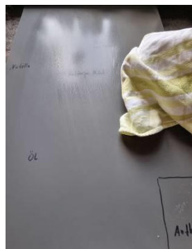
6. Front mit Baumwolltuch gleichmäßig trockenreiben