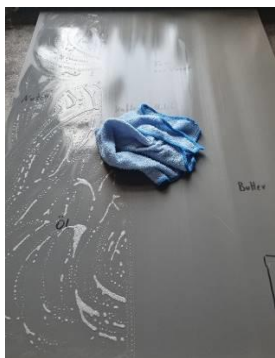
5. Reinigungsrückstände nach Wirkzeit mit heißem Wasser und Mikrofaser-tuch abnehmen